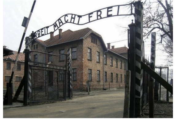
“Arbeit macht frei”（仕事は〔あなたを〕自由にする）の文字が掲げられたゲート