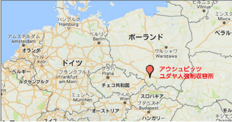
アウシュビッツ強制収容所地図 (Map of Auschwitz Birkenau, Poland)