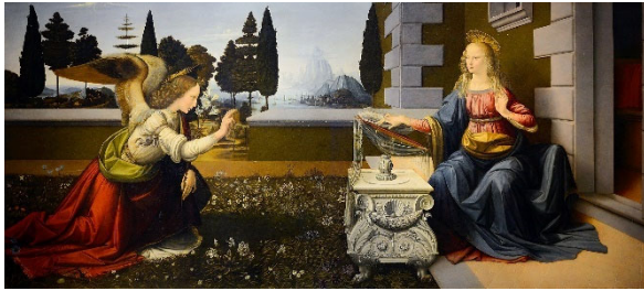
レオナルド・ダ・ヴィンチ作「受胎告知」

〔問題〕 下の絵画と説明を参考にして、ユダヤ教、キリスト教とイスラム教の共通点を指摘しなさい。